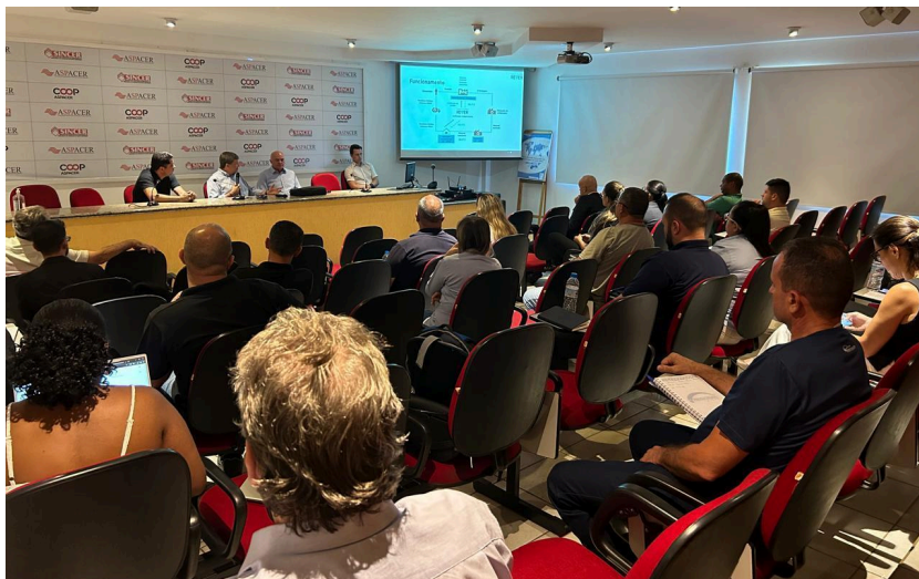
Representantes de empresas da indústria cerâmica, acompanhando evento na sede da Aspacer.