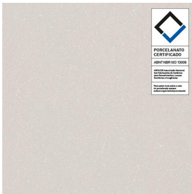
Modelo do selo inserido nas placas de porcelanato