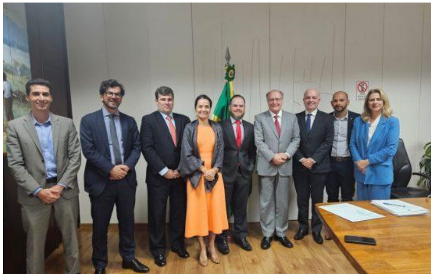
Registro da conversa com o vice-presidente, Geraldo Alckmin

Painel on-line "Novo Mercado de Gás" da Stonex